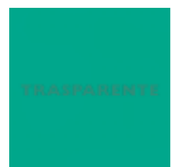
21-075 Verde Trasparente