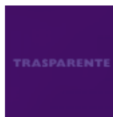
21-074 Bluviola Trasparente